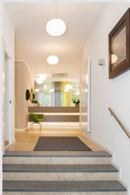
Grosszügig gestaltet: der neue Empfangsbereich im Erdgeschoss.