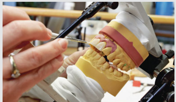
Bis ins kleinste Detail: Keramisch verblendete Front.