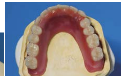
Ästhetikaufstellung/Diagnostisches Set-up (oben)