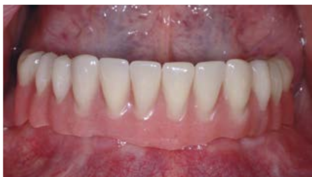
Reiseprothese in situ (unten)

Wer kann Reparaturen am Zahnersatz schon vorhersehen? Meist passiert es zum unpassendsten Moment: vor der Hochzeit der Tochter, einem Vorstellungsgespräch, einem wichtigen Kundentermin oder dem lang ersehnten Urlaub – oder noch schlimmer, während einem dieser Anlässe. Spätestens jetzt beginnt der Stress für Ihren Patienten, für Ihre Praxis und für uns. Das lässt sich mit überschaubarem Aufwand verhindern: Mit einer Reise- oder Ersatzprothese hat der Patient immer Ersatz für den Ersatz.