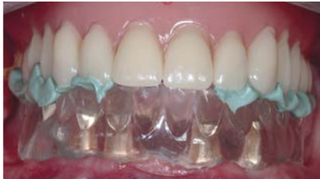
Bissnahme für UK-Reise- prothese mit Duplikat- prothese aus durchsich- tigem Kunststoff (oben)